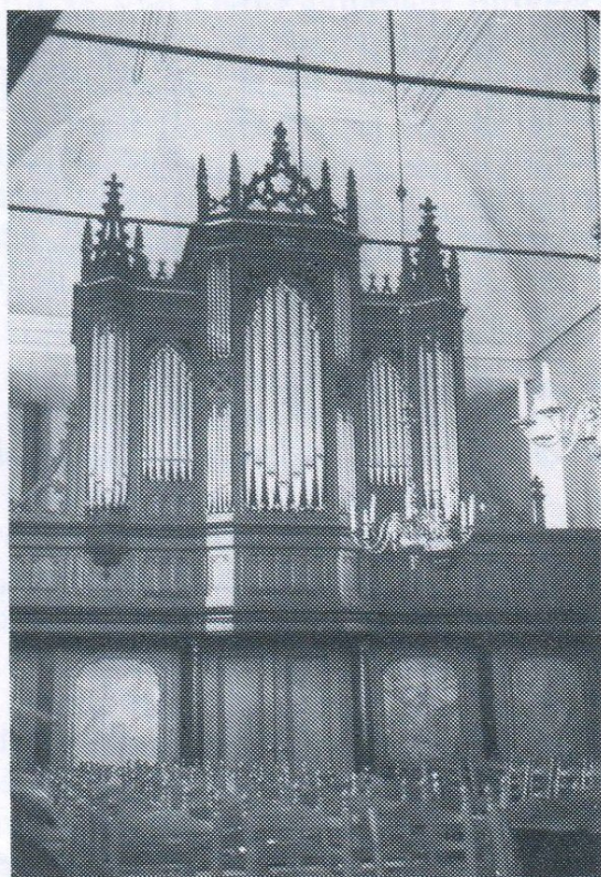
Eelde, Hervormde kerk: front

Frontpijpen van Engels tin. Binnenpijpen 1/3 tin en 2/3 lood. Windvoorziening d.m.v. een reservoirbalg met twee schepbalgen, te bedienen door een balanstrap-inrichting. Aannemingsom: f3850,00.