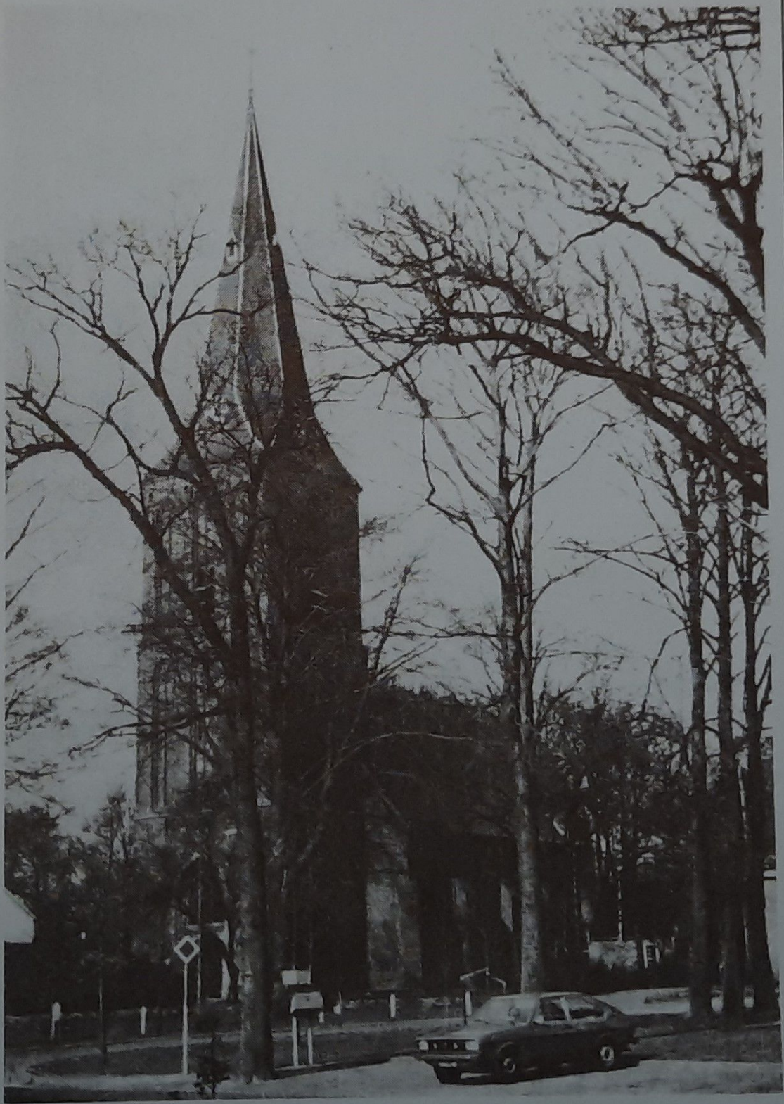
de hervormde kerk — Gleen —