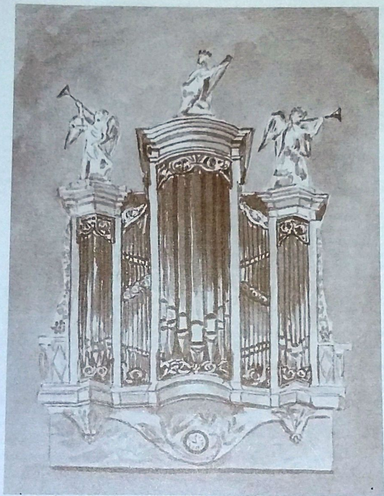
HET ORGEL IN DE DOOPSGEZINDE KERK TE KROMMENIE