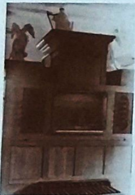
Achterzijde van het orgel

De zijwanden en de achterwand van de nieuwe kas werden in een bij de kleur van het front passende witte kleur geverfd.