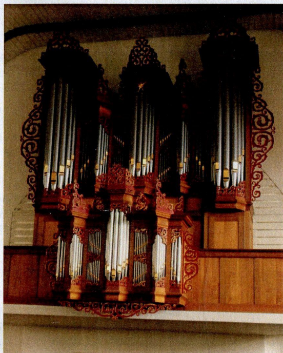
front van het Mense Ruiterorgel maart 2016

Het kerkgebouw krijgt andere kleuren, waarbij voor een deel wordt teruggegrepen naar de kleurstelling uit 1939. Daarbij wordt het lofwerk van het orgel van enig bladgoud voorzien. Na 1990 is er een periode van consolidatie en is er alleen sprake van regulier onderhoud.