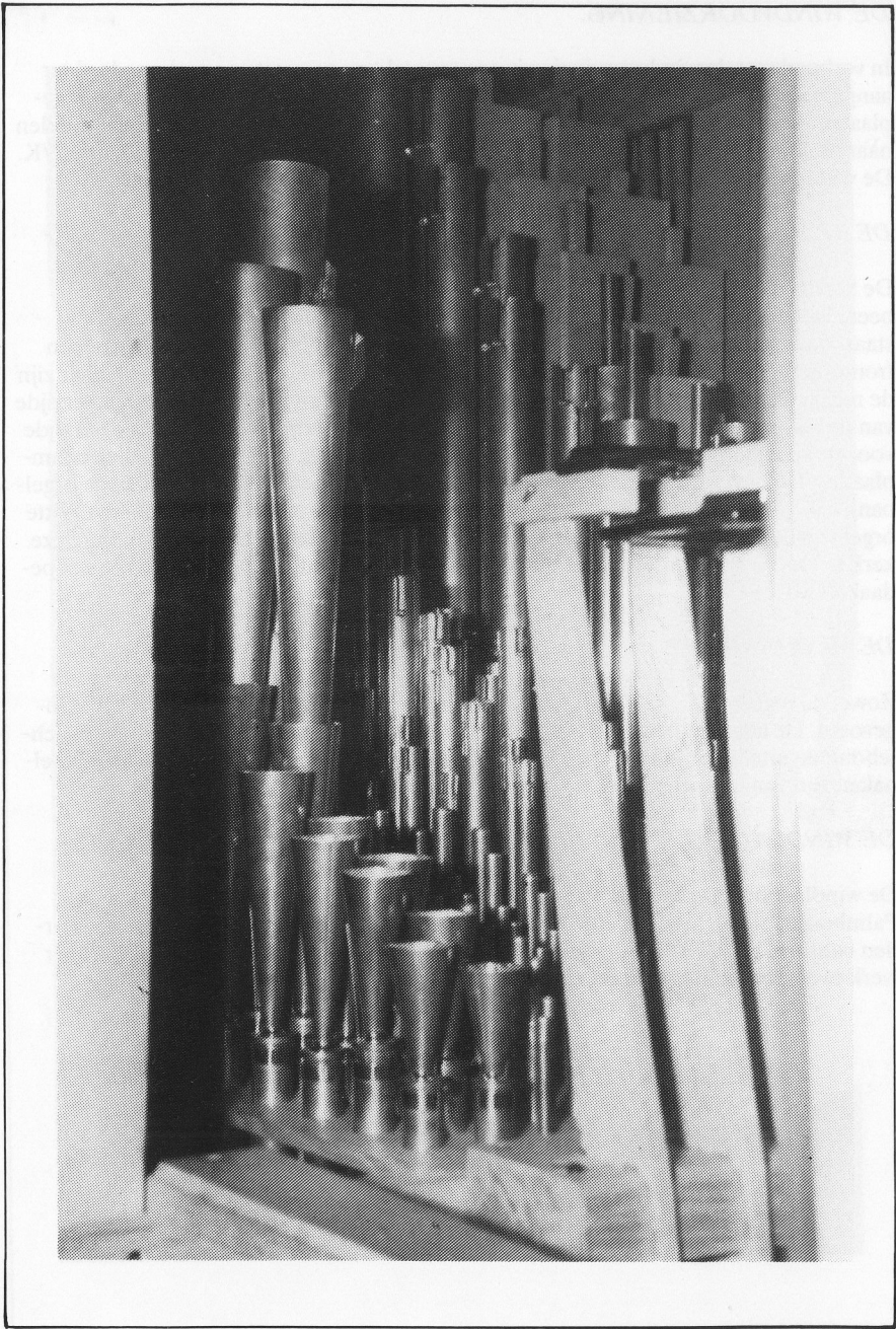
het hoofdwerk (trompet)