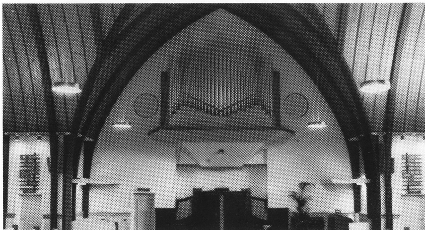
het oude orgel