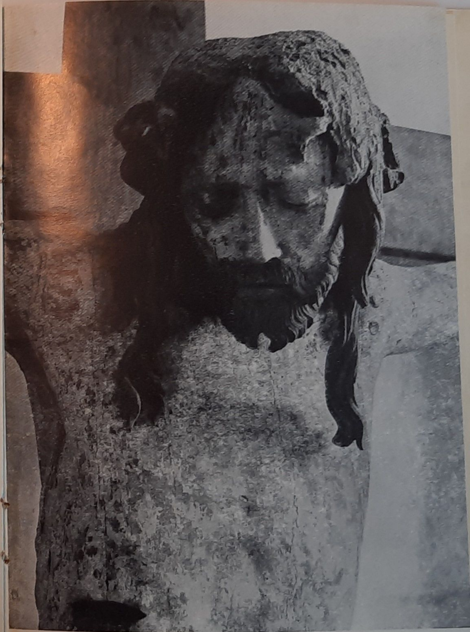
Christ souffrant Eglise de Feuges (Aube)