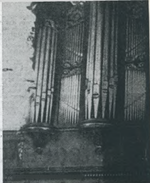
★ Het uit Raalte afkomstige instrument, dat vervangen.

Warnsveldse orgel evenals het oude wit zal worden geschilderd. Met de restauratie is naar verwachting een half jaar gemoed.